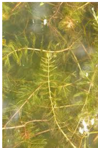
Le myriophylle en épi, présent dans certains lacs d'Austin

La navigation sur le lac Memphrémagog requiert un certificat d'usager ou un certificat de lavage (valable pour 48 heures). Les citoyens d'Austin peuvent se procurer le certificat d'usager gratuitement au bureau municipal ou au quai Bryant, durant les heures d'ouverture. Le certificat d'usager ne vous relève pas de la responsabilité de laver votre embarcation si vous l'utilisez sur un autre plan d'eau.