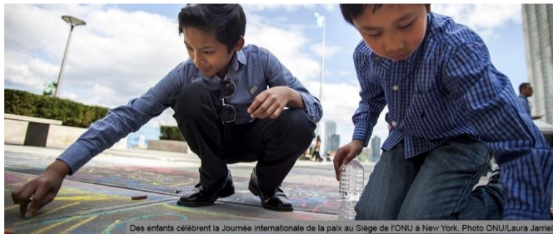
Des enfants célèbrent la Journée internationale de la paix au Siège de l'ONU à New York.

« Rien n'est plus important que de bâtir un monde dans lequel tous nos enfants auront la possibilité de réaliser pleinement leur potentiel et de grandir en bonne santé, dans la paix et dans la dignité. »